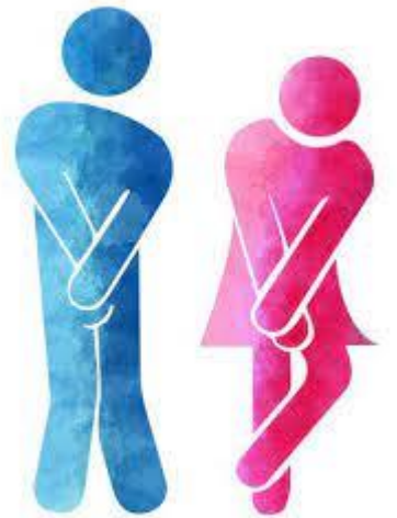
急著上厕所的同学