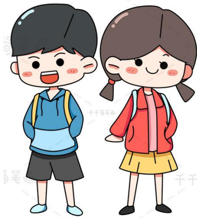
路上遇到的同班同学