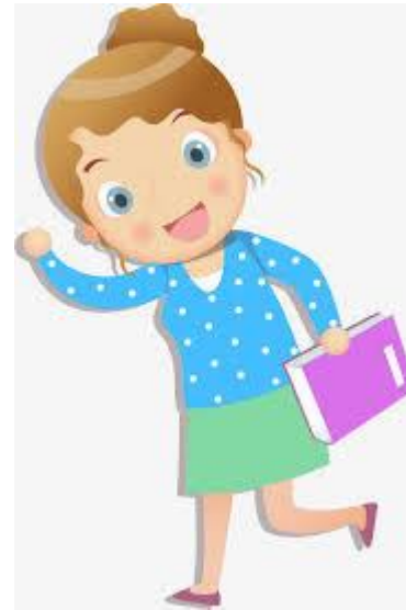
剛好走進教室的老師