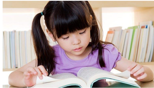
一個人在 看書的同 學