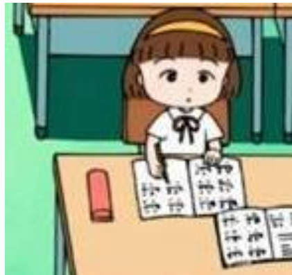
坐在你隔壁的同學