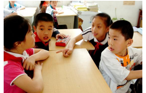
圍在一起聊天的同學