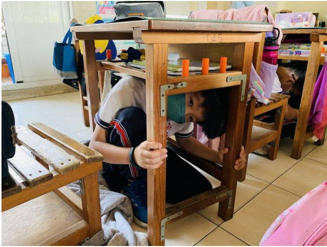
地震警報響起，師生立即就地掩蔽