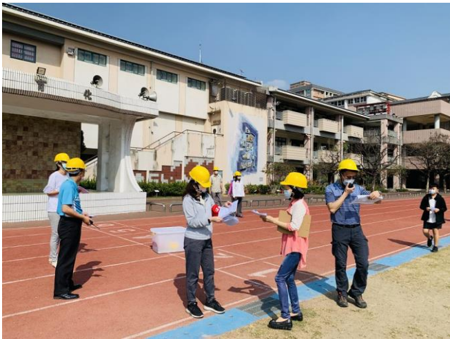
啟動緊急應變組織，進行後續狀況處置