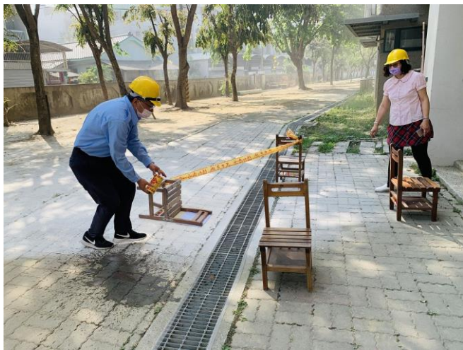
火災現場外圍圍起警戒線