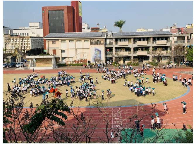
於地震稍歇時，立即進行疏散避難