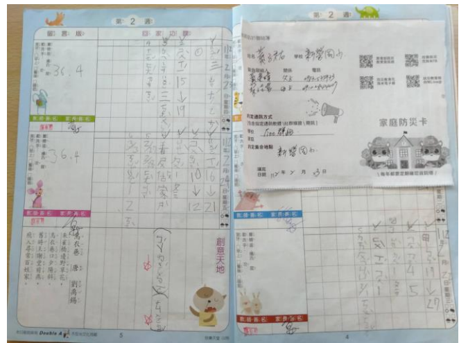
學生家庭防災卡黏貼於家庭聯絡簿中