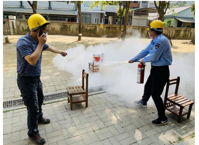
進行火災現場模擬演練