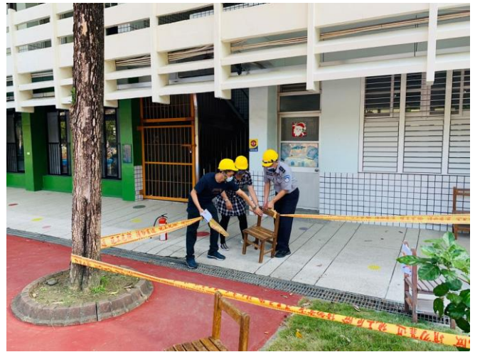
火災現場外圍圍起警戒線