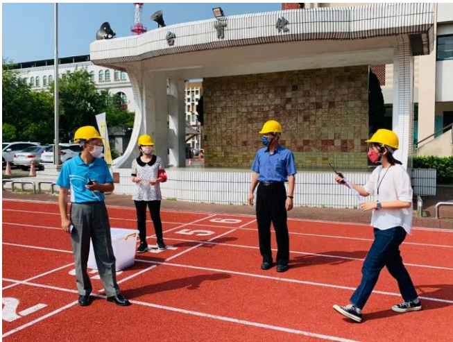
啟動緊急應變組織，進行後續狀況處置