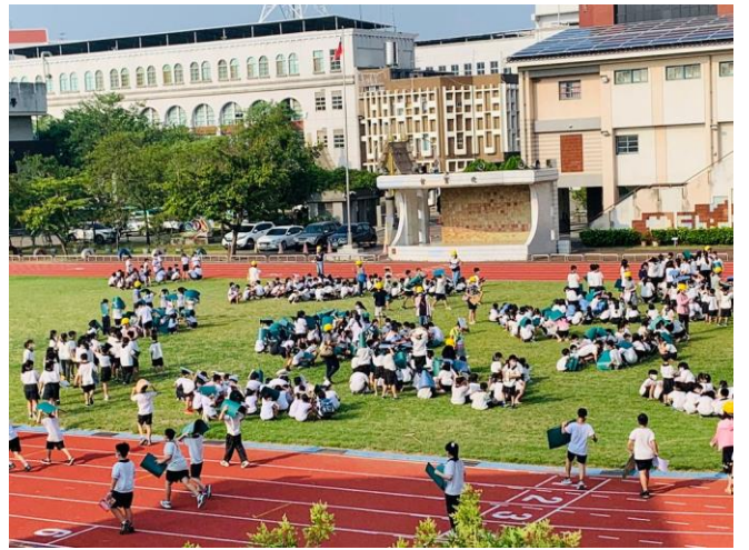
於地震稍歇時，立即進行疏散避難