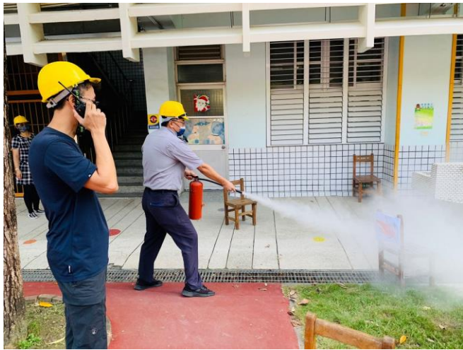
進行火災現場模擬演練