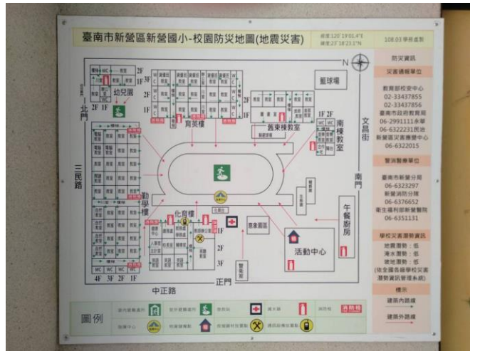
校園張貼防災避難地圖，提供師生明確指引