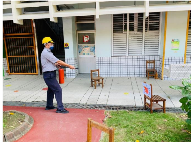
進行火災現場模擬演練