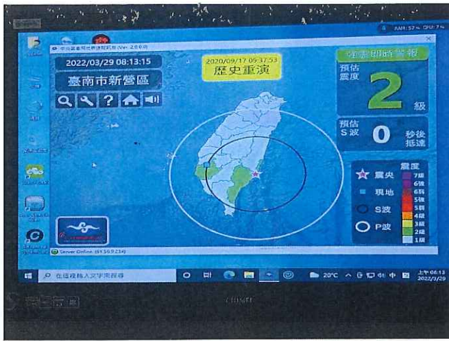
主機螢幕與中央氣象局強震即時警報軟體連線