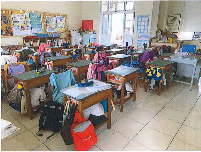
演練地震發生時確實做到趴下、掩護、穩住