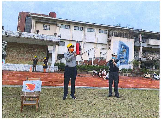
針對全校師生進行防火及逃生安全相關宣導