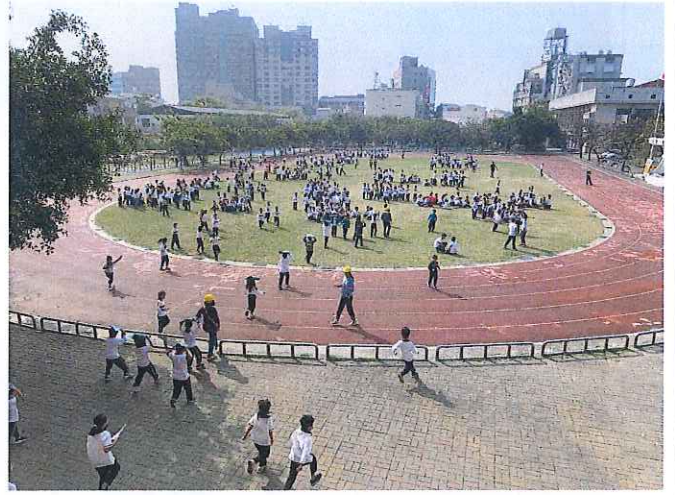
於地震稍歇時，立即進行疏散避難