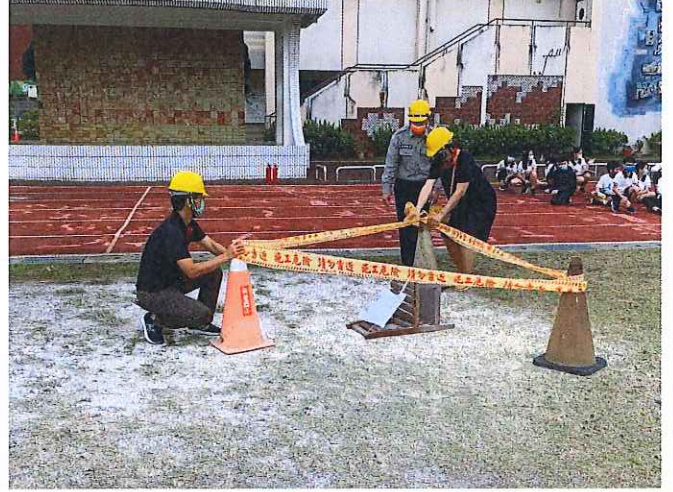
於火災現場外圍圍起警戒線