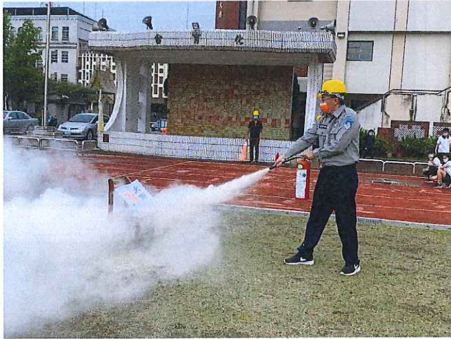
進行火災模擬及滅火器操作演練