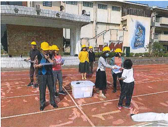
啟動學校緊急應變組織，進行後續狀況處置