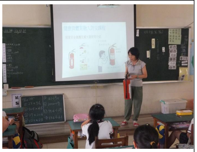
班級導師於課堂向學生宣導預防火災相關知識