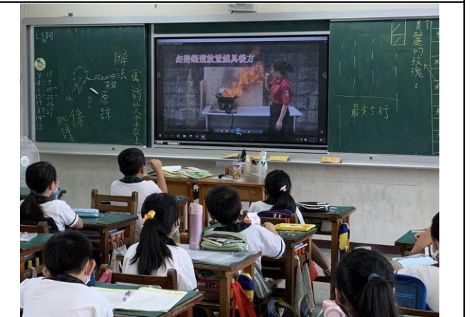
班級導師利用火災影片宣導預防火災相關知識