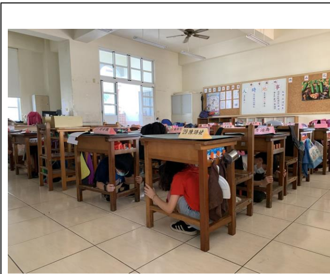
地震警報響起，師生立即就地掩蔽