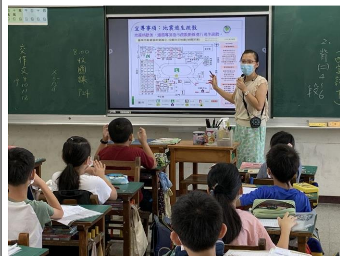
班級導師向學生宣導逃生疏散路線