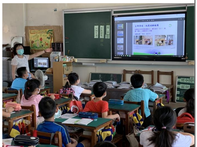
班級導師向學生宣導地震避難知識