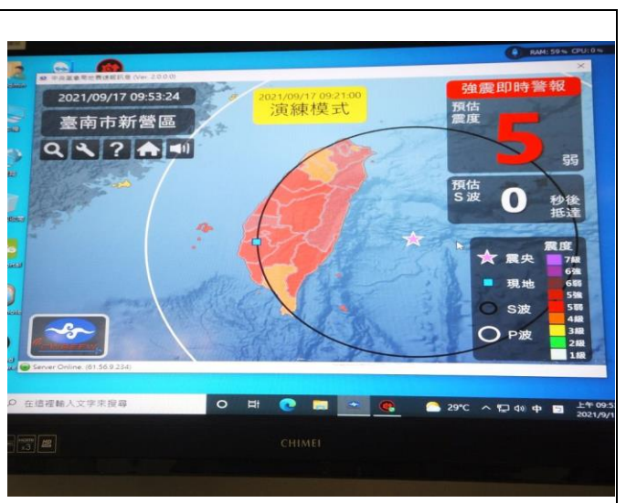
主機螢幕與中央氣象局強震即時警報軟體連線