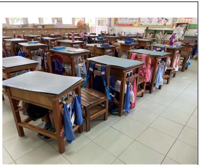
地震警報響起，師生立即就地掩蔽