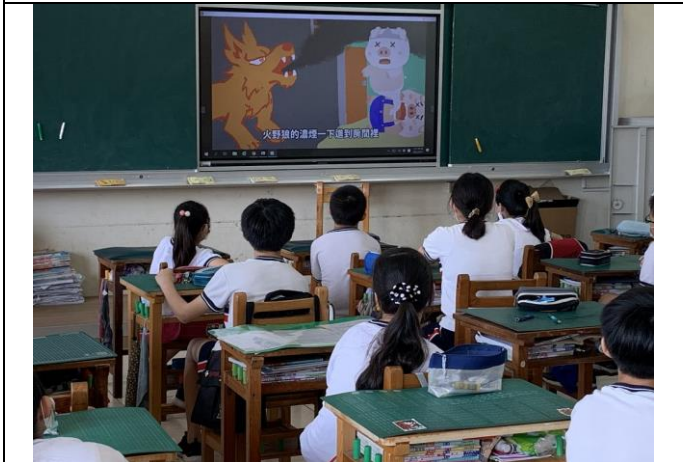
班級導師利用火災影片宣導預防火災相關知識